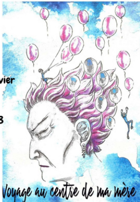
Voyage au centre de ma mère