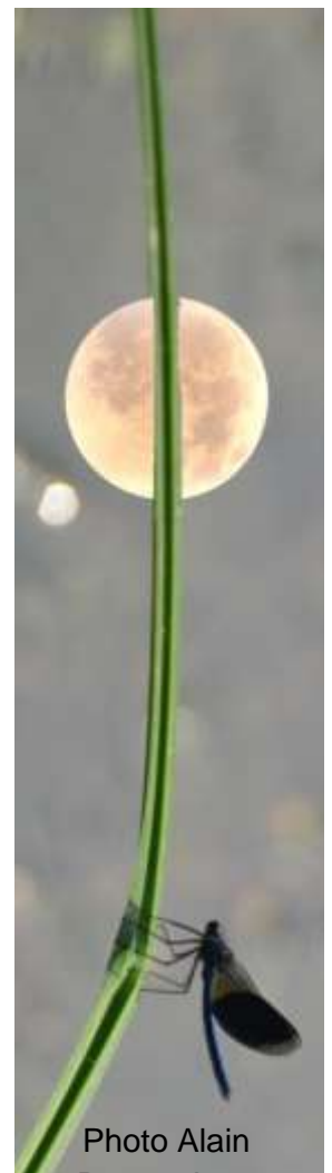
Photo Alain Derrey Jean Commissaire Retouche photo sur logiciel Corel Paint Shop Pro

"Les cours continuent à la fois via ZOOM et les envois de didacticiels vidéo" Alain Derrey